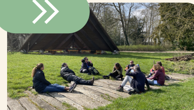
et balade en nature