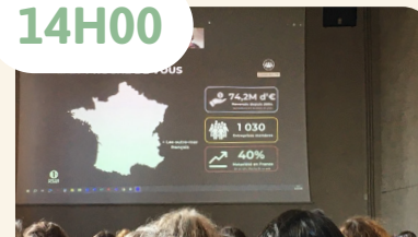
Pistes de financements