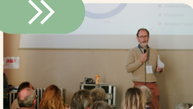
et le récit des 3 années de l'AAC