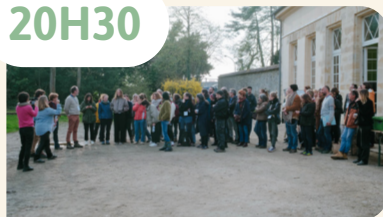
Film « Tous Dehors »