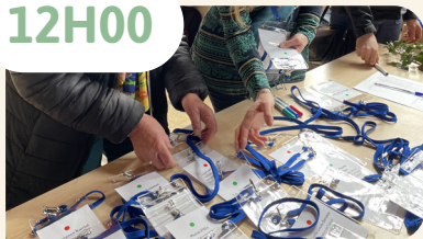
Arrivée à Jambville