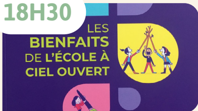
Les bienfaits de l'école à ciel ouvert