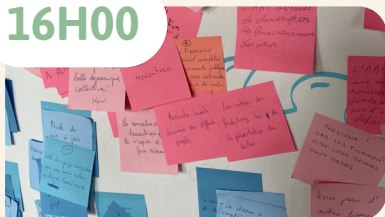
Vos retours sur l'AAC